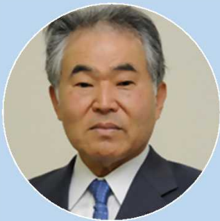
大竹英雄 名誉碁聖