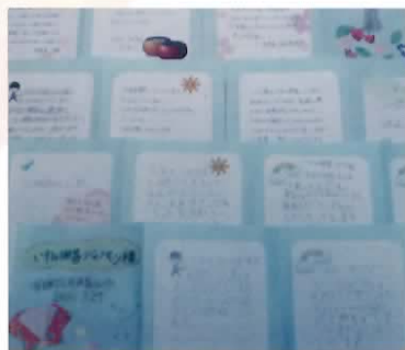
可愛いイラスト入りの寄せ書き

この大会は、幼・小・中学校生の3人の団体戦で、学研の応援を得て今年第十回になる。大会が無事に終了