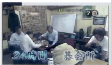
NHKの人気番組ドキュメント72