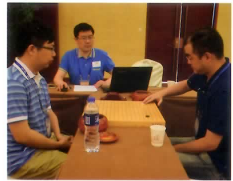
優勝した中国代表白さん(左)と筆者との対局

6月5〜8日に中国の無錫市で行われた世界アマチュア囲碁選手権に日本代表として参加してきました。優勝は中国の選手で、自分自身は8戦して6勝2敗、5位という成績でした。今回で5回目の出場となりましたが、参加して感じたことを何点か書かせて頂きます。 まず世界のレベルが上がっている事です。上位の常連であるアジア各国（中国・韓国・台湾）は大きな変化はありませんが、ヨーロッパではプロ組織が誕生